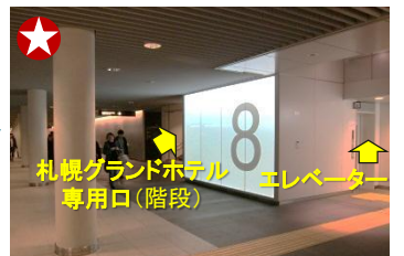
約300mほど進むと、右に大きな「8」のパネルが見えてきます。その奥に札幌グランドホテルの専用入口（階段）があります。階段を上るのが困難な場合は8番パネル手前のエレベーターをご利用ください。