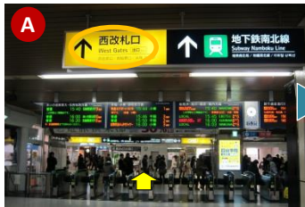
JR札幌駅に到着したら、 西口 から改札を出てください。