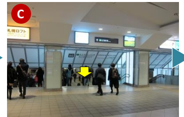
エスカレーターを降りたら、 南方向 （進行方向）へさらに約100m進み、地下鉄南北線さっぽろ駅に繋がる短い 階段 を下りてください。