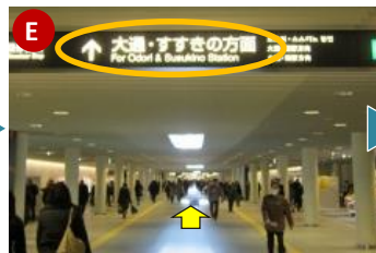
札幌駅前通地下歩行空間をそのまま 大通・すすきの方面 に向かって進んでください。