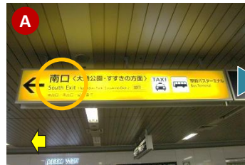
西改札口を出たら、 南口 （左手方向）に向かって約100m進んでください。