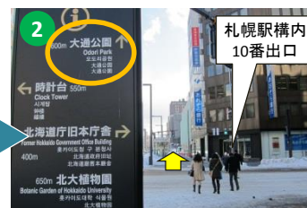
そのまま 南方向 （大通公園方面）に約300m直進します。