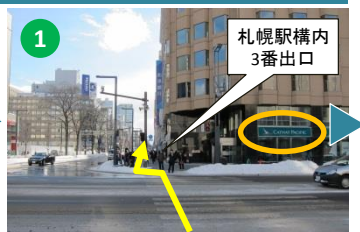
右手の「キャセイパシフィック航空」前の横断歩道を渡り直進します。