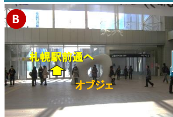
札幌駅南口のオブジェ左手から外に出てそのまま約100m直進します。