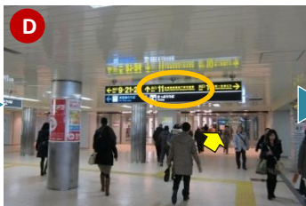
約130mほど進むと 地下鉄南北線さっぽろ駅の南改札口 があります。左手に改札口を見ながら通路を更に直進すると、札幌駅前通地下歩行空間の入り口があります。