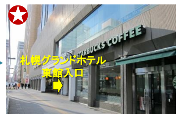
スターバックスコーヒーの入っているビルが札幌グランドホテル東館です。