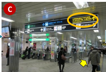
階段を降りたら、目の前に 地下鉄南北線さっぽろ駅の北改札口 があります。改札には入らず、そのまま通路を 南方向 に進んでください。