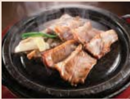
ラム肉の石焼き Ishiyaki (Traditional Japanese Stone Grill) Lamb ¥1,200