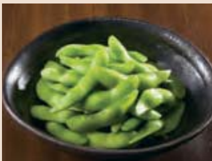
枝豆 Tasty Edamame ¥350