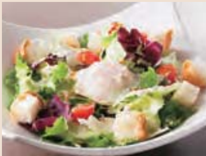
温玉シーザーサラダ Caesar Salad w/Soft-Boiled Egg ¥800