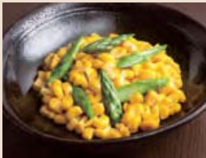
北海道産バターコーン Sautéed Butter Corn from Hokkaido ¥550