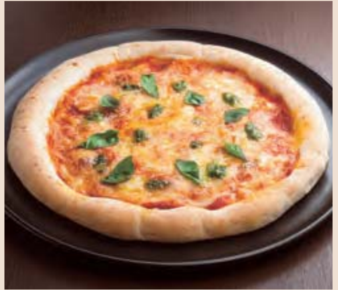
ナポリ風ピザマルゲリータ Margherita ¥1,200