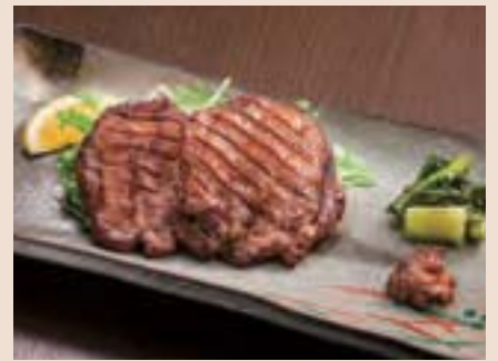
厚切り牛タン炙り焼き Grilled Oxtongue ¥1,200