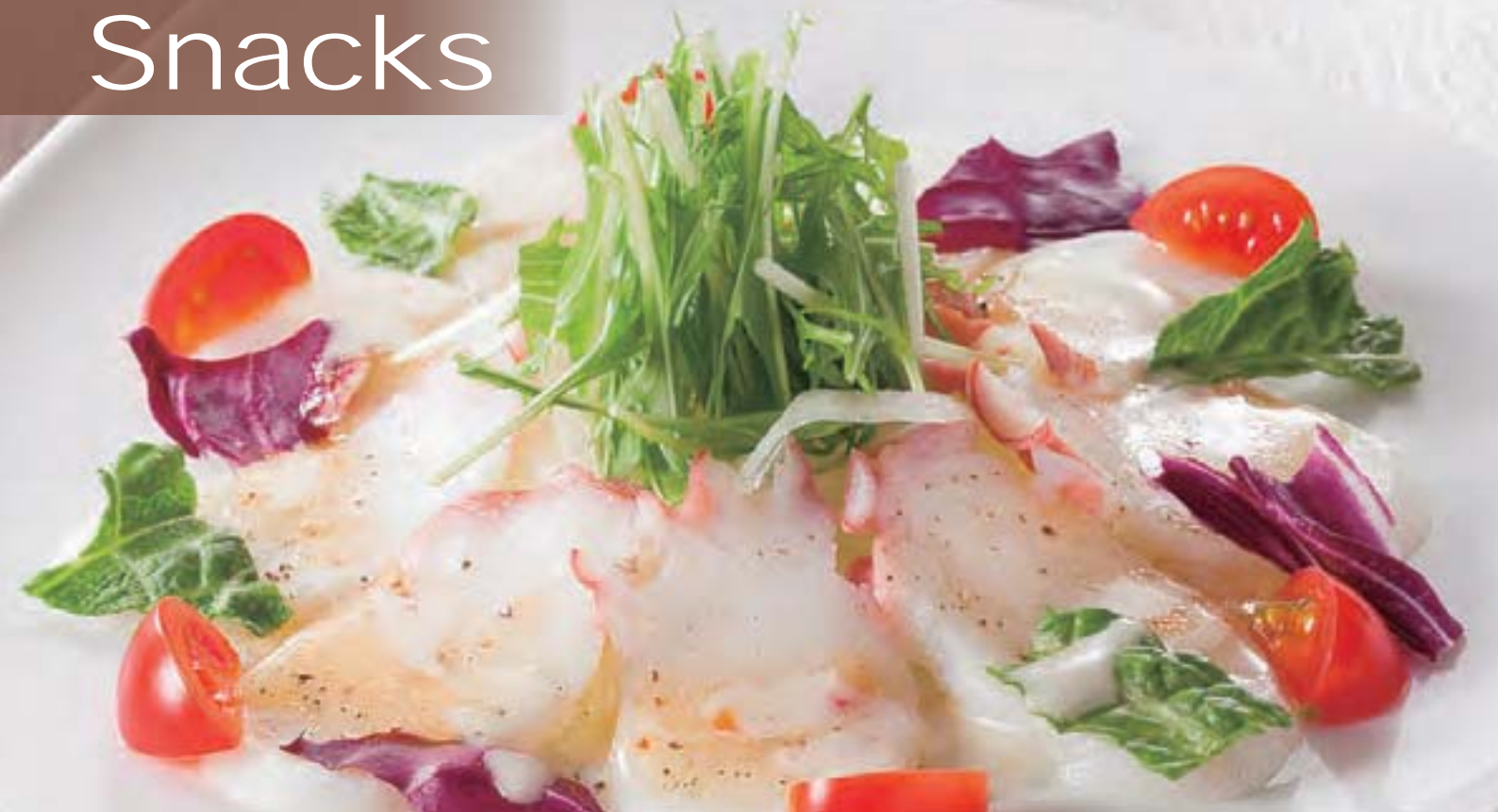
北海道産たこのカルパッチョ Carpaccio of Octopus from Hokkaido ¥850