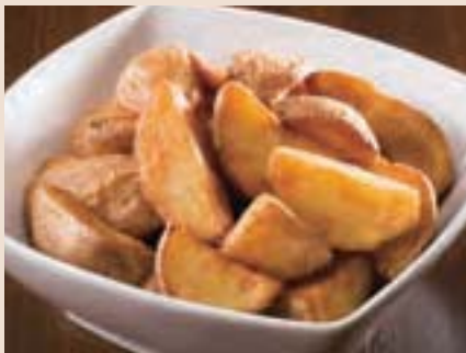
十勝芽室産じゃが芋のフライドポテト French Fries from Hokkaido ¥600