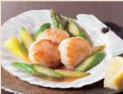
北海道産帆立貝のバターソテー Sautéed Scallop w/Butter ¥800