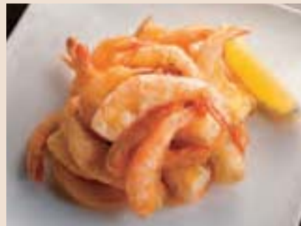
小海老の唐揚げ Deep Fried Shrimp ¥700