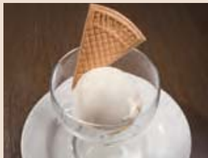
バニラアイスクリーム Vanilla Ice Cream ¥350