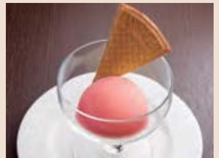
本日のシャーベットまたは アイスクリーム Today's Sherbet or Ice Cream ¥350

※表示料金には、サービス料および税金が含まれております。 All prices include service charge and tax.