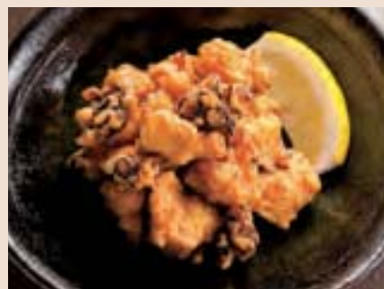
たこザンギ Deep Fried Octopus ¥750