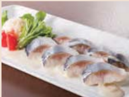
自家製鰯のマリネ Marinated Herring ¥700