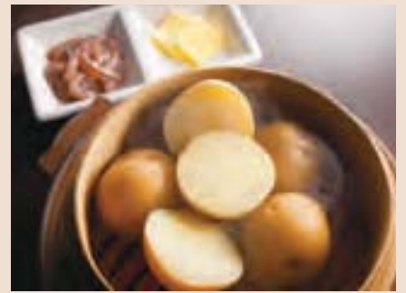
北海道産じゃがバター いかの塩辛添え Steamed Potato w/Butter & Pickled Squid ¥600