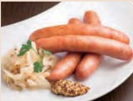
北海道産粗挽ポークウィンナー Pork Sausage from Hokkaido ¥900