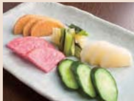
本日の漬物盛り合わせ Assorted Japanese Pickles ¥650