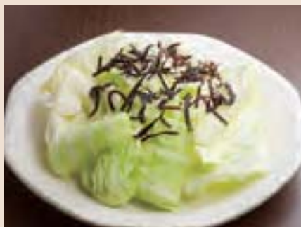
塩昆布とキャベツのサラダ Salad of Cabbage w/Salted Sea Tangle ¥450