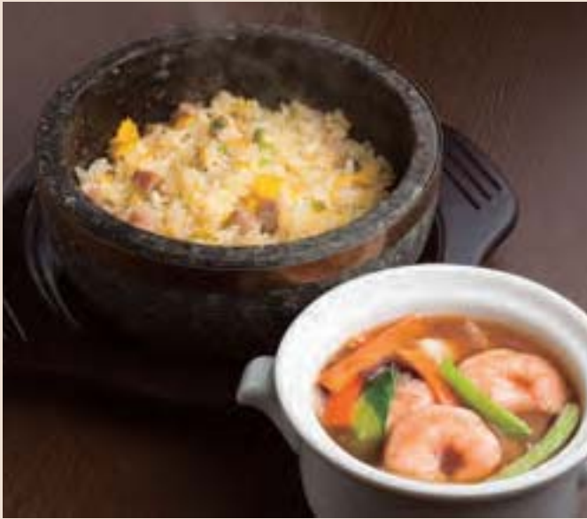
あんかけ石焼炒飯 Fried Rice w/Bean Jam ¥1,000