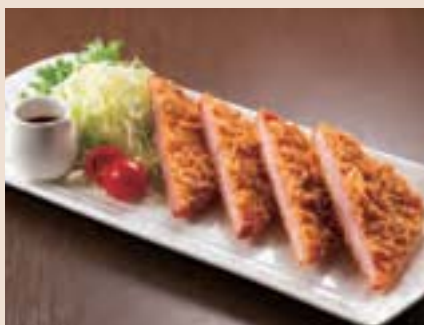
北海道産厚切ポークハムカツ Deep-fried Ham ¥950