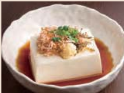
北海道産大豆の冷奴 Cold Tofu Produced in Hokkaido ¥550