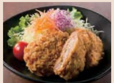
北海道産ビーフメンチカツ Minced Meat Cutlet ¥950