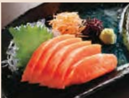
サーモンの刺身 Sashimi Salmon ¥750