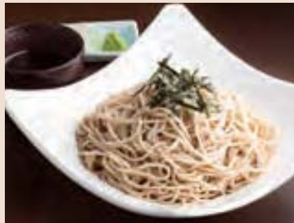
北海道幌加内産ざるそば Soba (Cold) ¥700