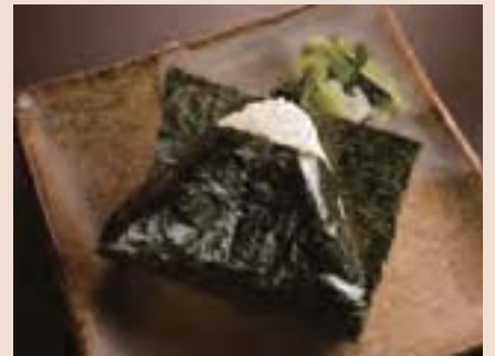
おにぎり (鮭、梅、たらこ、山わさびおかか) Rice Ball Choice of Salmon,Ume,Tarako or Wasabi-Tasted Katsuobushi ¥300