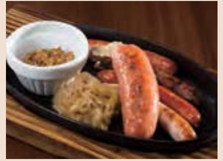
ソーセージ5種盛り合わせ Assorted Grilled Sausages ¥1,600