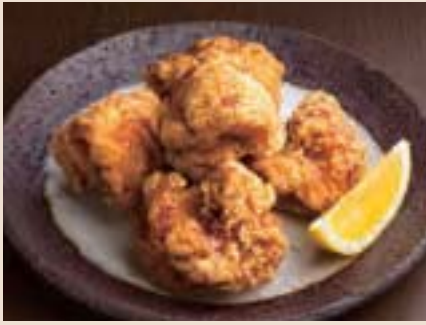
鶏肉ザンギ (5P) Fried Chicken (5pieces) ¥550

元祖ラーメンサラダをはじめ、伝統の逸品が勢揃い。北海道の美味しさをご堪能ください。