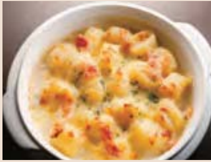
“北あかり”ニョッキとベーコンのクリームグラタン Gratin w/Potato Gnocchi & Bacon ¥750