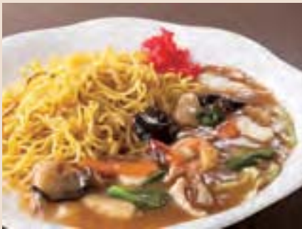
あんかけ焼きそば Fried Noodles w/Bean Jam ¥1,000