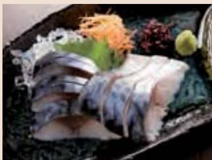
釧路産しめ鯖 Marinated Mackerel from Kushiro ¥900