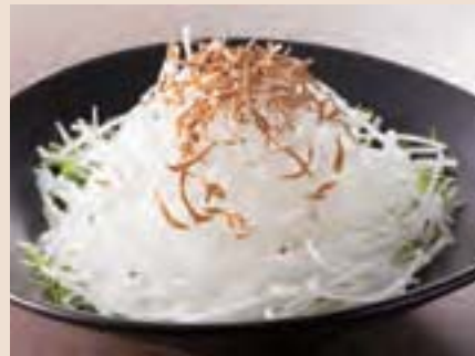
大根とじゃこのサラダ Radish Salad w/Dried Young Sardines ¥550