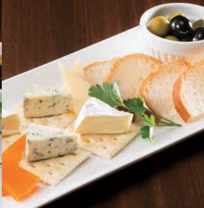
北海道産4種チーズの盛り合わせ Assorted Cheese from Hokkaido ¥1,300