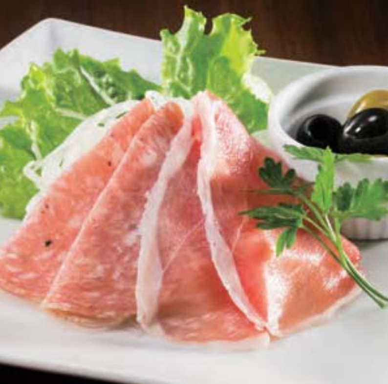
北海道産生ハムと生サラミの盛り合わせ Assorted Raw Ham & Raw Salami Sausage from Hokkaido ¥950