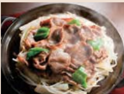
ラム肉の鉄板焼き“ジンギスカン” Grilled Lamb "Genghis Khan" Style ¥1,200